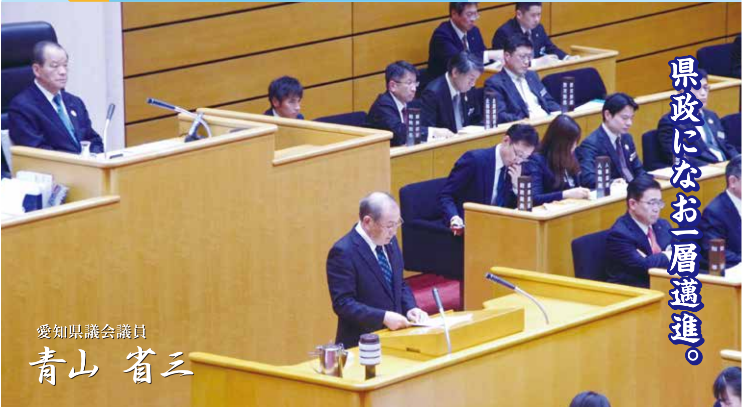
愛知県議会議員 青山 省三